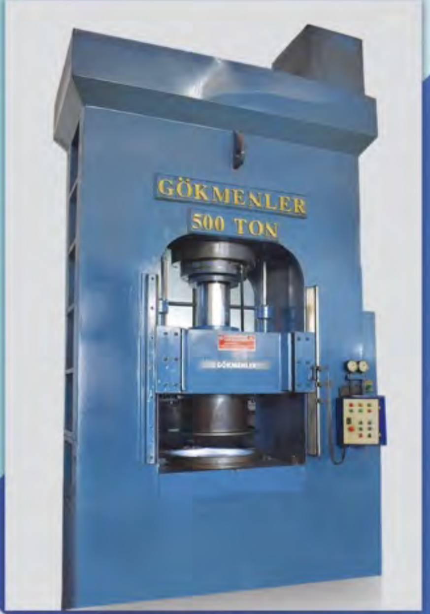
Hidrolik Sivama ve Eksantrik Presler Hydraulic Spinning and Eccentric Presses