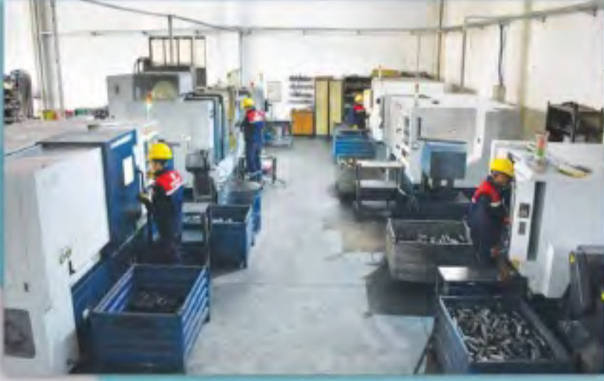
CNC Tornalar CNC Lathes