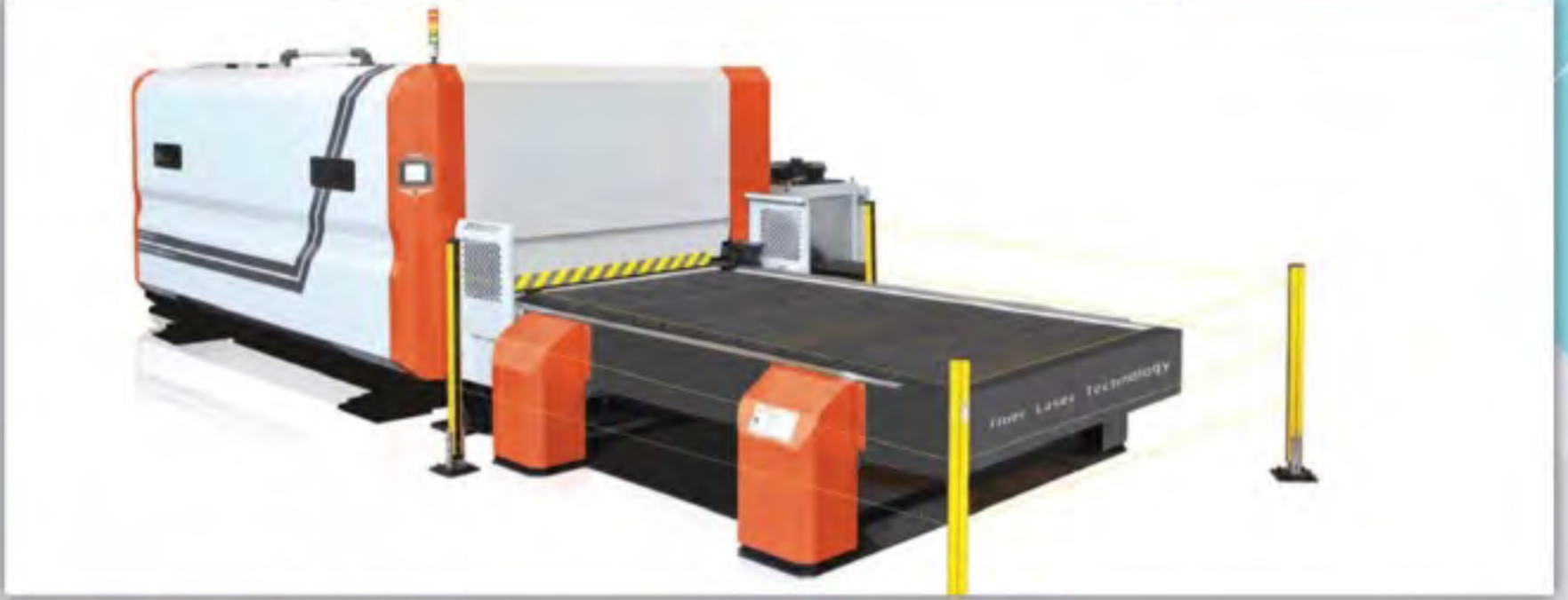
Lazer Kesim Makinaları Laser Cutting Machines