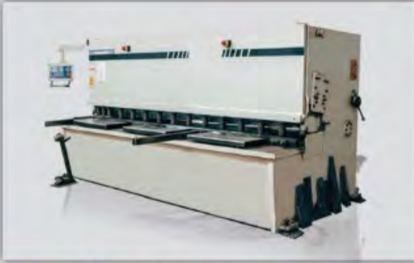
Giyotin Kesim Makinaları Guillotine Cutting Machines