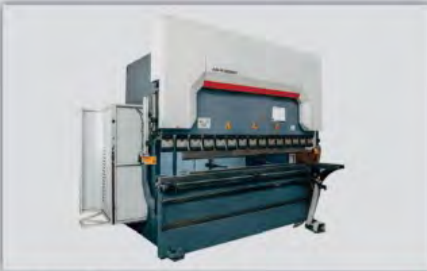
Abkant Büküm Makinaları Press Brake Twisting Machines