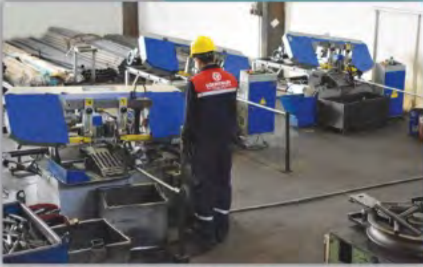
Otomatik Şerit Testereler Automatic Band Saws