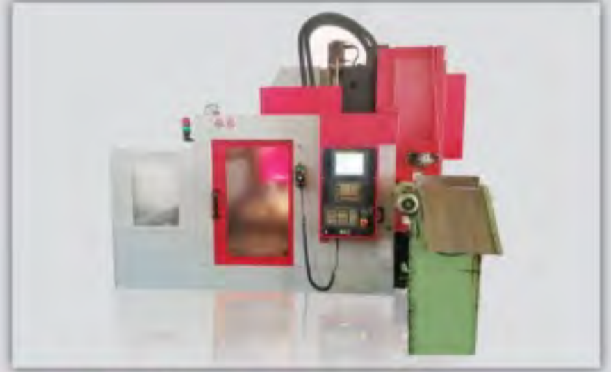
CNC Dik İşleme Merkezleri CNC Vertical Machining Centers