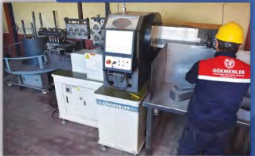
CNC Tel Bükme Makinaları CNC Wire Bending Machines