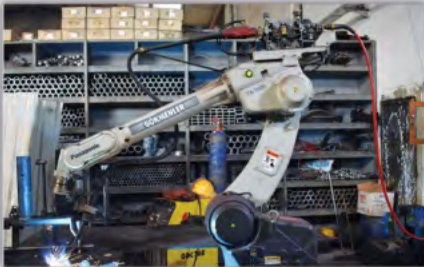
6 Eksenli Kaynak Robotları 6 Axis Welding Robots